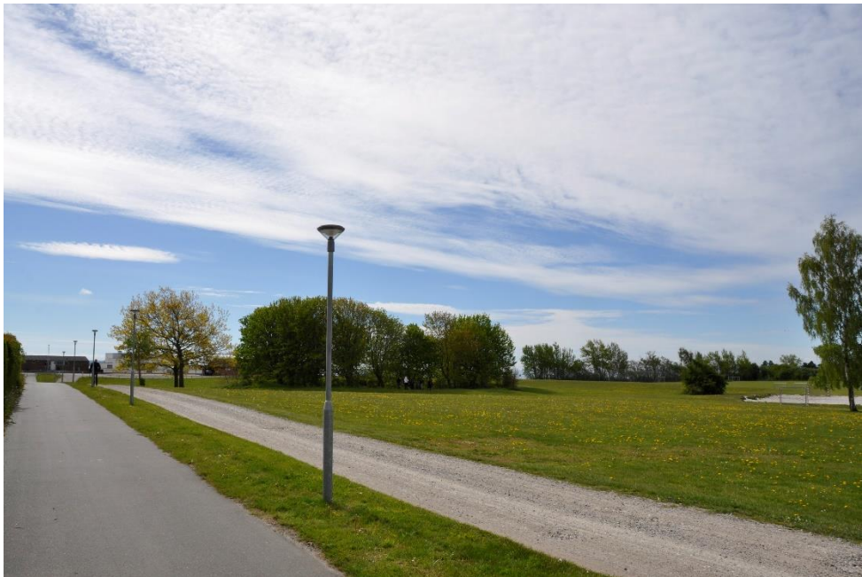
Fig. 6. Fotostandpunkt F2.