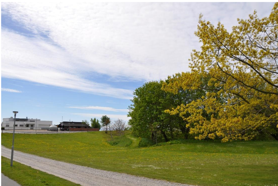
Fig. 7. Fotostandpunkt F3.