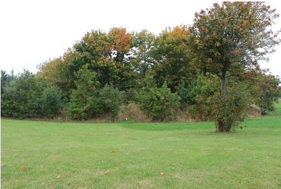
Fig. 9. Fotostandpunkt F8.