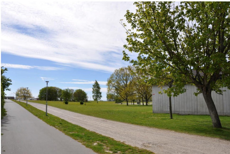
Fig. 5. Fotostandpunkt F1.