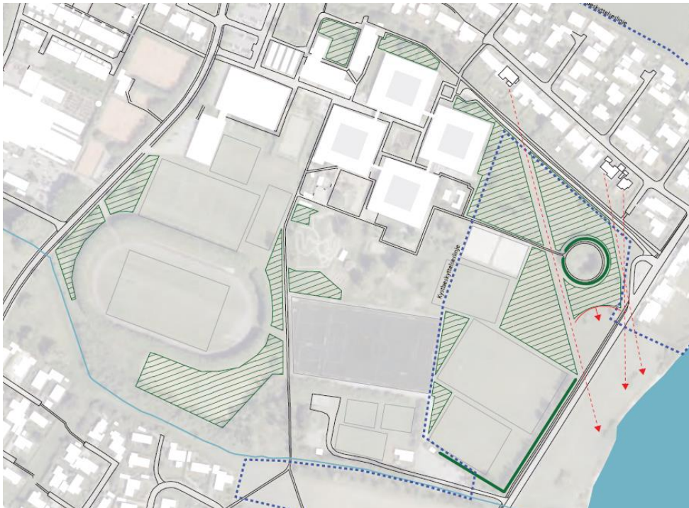
Fig. 2. Billede fra ansøgningen. De grønne skraveringer viser de mulige udpegede arealer til etablering af beplantning.

Det fremgår endvidere af ansøgningen, at børneskoven ønskes etableret etapevis i umiddelbar nærhed af skolens arealer. Børneskoven er et langsigtet projekt, da den udvides i takt med, at skolen får nye klasser/elever. Området med den fremtidige børneskov vil i begyndelsen fremstå som en åben lund, der gradvis vil blive fortættet, når der tilplantes med nye skovparceller/klasseparceller.