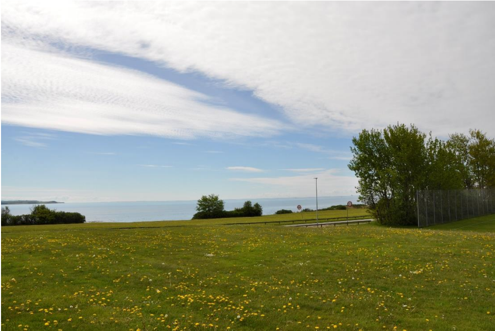
Fig. 8. Fotostandpunkt F4.