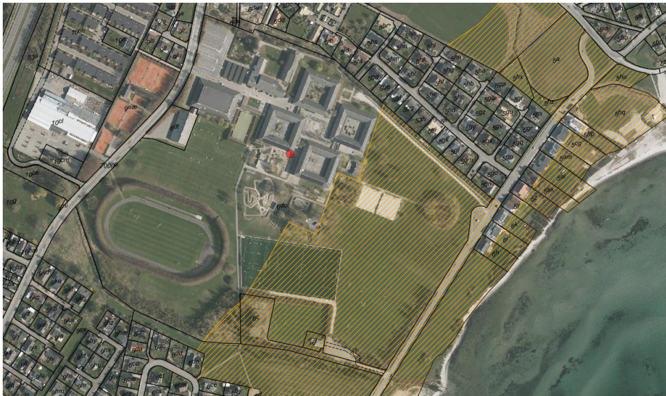
Fig. 1. Ortofoto 2019. Den røde prik markerer Skæring Skole. Det orange skraverede område markerer det strandbeskyttede areal. De umatrikulerede arealer ud til kysten samt stranden er dog også omfattet af bestemmelserne om strandbeskyttelse. De sorte streger markerer matrikelskel.

Det fremgår af ansøgningen, at "Skæring Børne Skov er et projekt, hvor alle børn i Skæring skoledistrikt planter et træ, som tilsammen med de andre børns træer udgør Skæring Børne Skov. Træerne plantes på en måde, så der skabes forskellige skovområder eller biotoper, der kan bruges i læringssammenhænge. Nye børn, planter nye træer således, at skoven over årene vokser, som et konkret symbol på, at det er børnenes træer, som bidrager til at gøre en forskel for klimaet i børnenes fremtid."