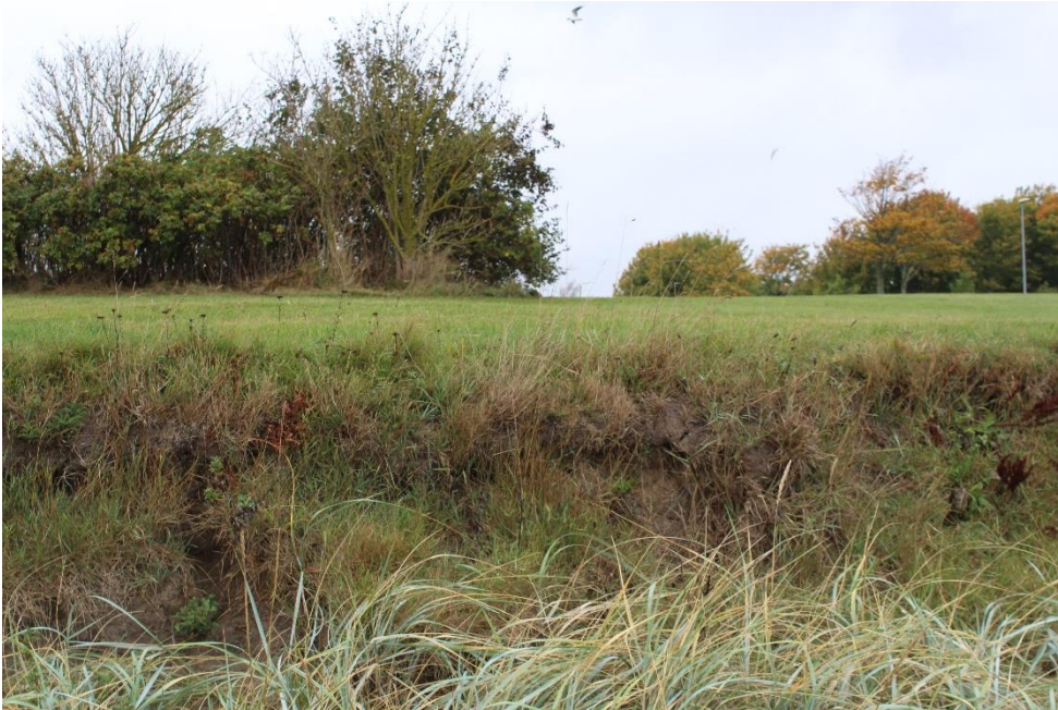
Fig. 10. Fotostandpunkt F11.